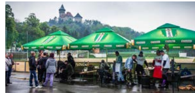
VO VARENÍ GULÁŠA SÚŤAŽILO DVANÁŠŤ TÍMOV > 7