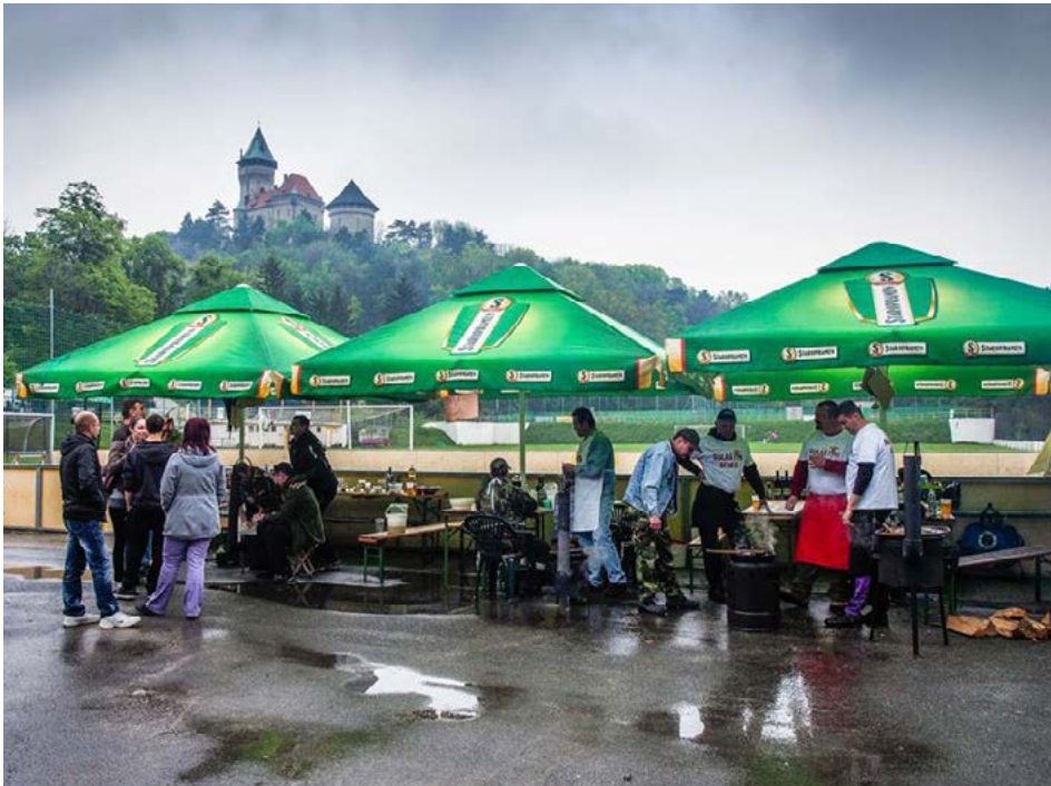
Daždivé počasie neodradilo súťažiacich ani návštevníkov. Dvanásť kotlíkov guláša sa rozpredalo za dve hodiny.