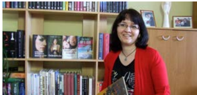
OD MALIČKA BOLA KNIHOMOL. DNES PÍŠE ROMÁNY > 6