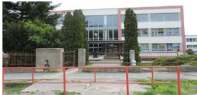
KAPACITA ŠKÔLKY NESTAČÍ. PRE DETI NIE JE MIESTO > 3