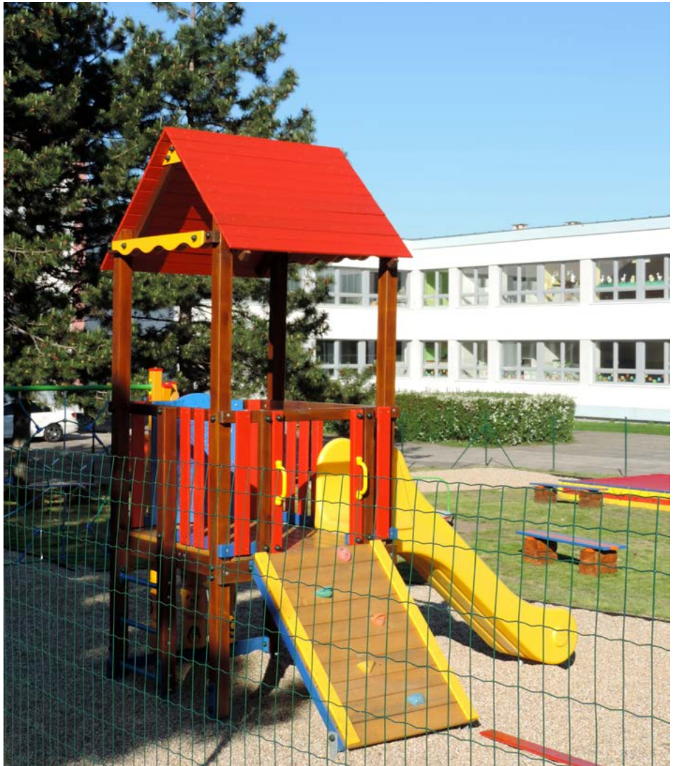
Obec už dnes nevytvára podmienky pre mladé rodiny. No čo ak sa počet detí začne ešte zvyšovať?

Druhou možnosťou je Súkromná materská škola Lienka. Tá prijíma približne dvojročné deti v podstate kedykoľvek a odkiaľkoľvek. Dieťaťo môže mať plienku, cumlík, flášu a je zaradené do menšej skupiny detí vo veku 2 – 4 roky. Môže