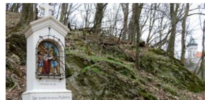
PRÁCA NAŠICH DŮCHODCOV JE ČASTO PREHLIADANÁ ▶ 4