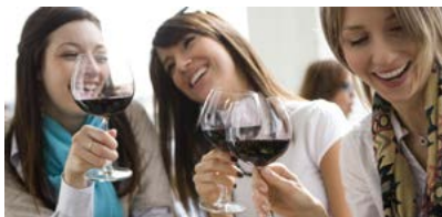
SMOLENICE MAJÚ BYŤ MIESTO, KDE TO ŽIJE ▶ 3