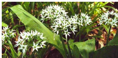
MEDVEDÍ CESNAK: ZELENÝ POKLAD NAŠICH LESOV ▶ 3