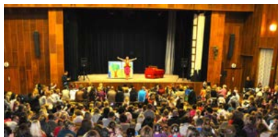
DO SMOLENÍC PRICHÁDZA VIAC ZÁBAVY PRE DETI ▶ 2