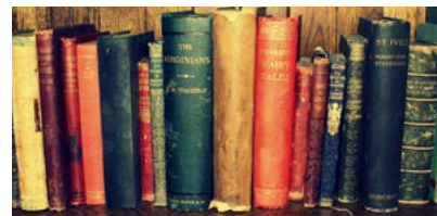
NEMILOVAŤ KNIHU ZNAMENÁ NEMILOVAŤ MÚDROST ▶ 4