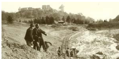
SMOLENICE SÚ MULTIKULTÚRNE. UŽ PO STÁROČIA ► 5