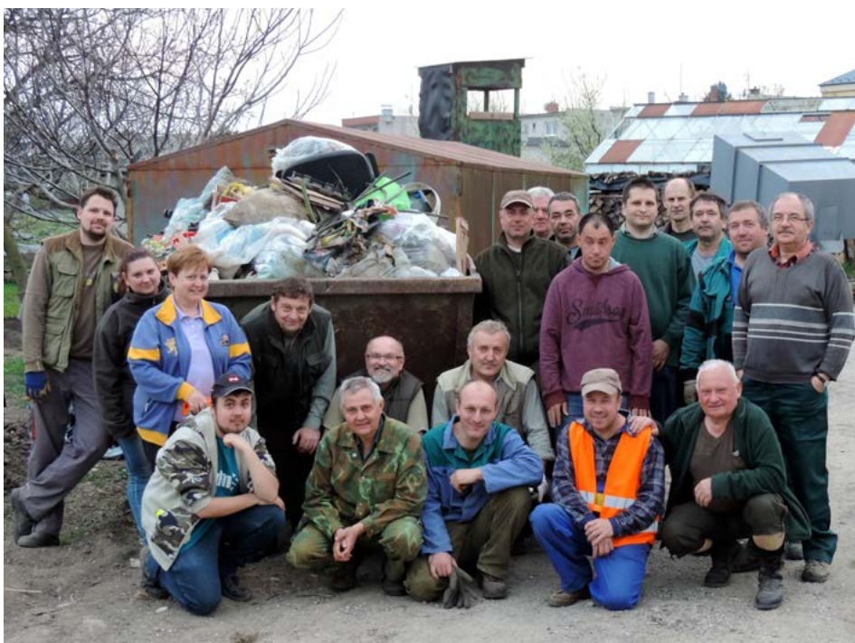
Poľovníci s rodinami a priateľmi vyzbierali v okolí Smoleníc až 12 metrov kubických odpadu.

Po vyložení všetkých nazbieraných odpadkov, sme zistili, že nebude stačiť