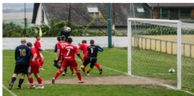
OŠK PLÁNUJE ZASTREŠIŤ VIACERO ŠPORTOV ► 6