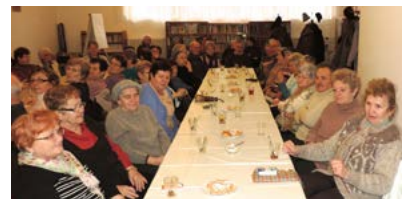
SPUSTILI SME PROJEKT „BEZPEČNE DOMOV“ ► 8