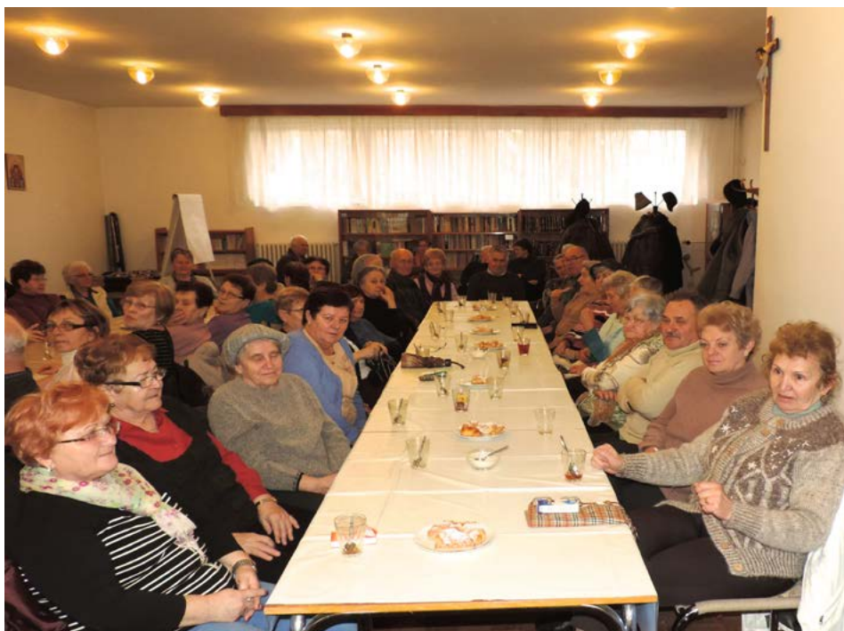
Prvá prednáška o bezpečnosti sa uskutočnila 19. februára na Farskom úrade aj vďaka spolupráci s príslušníkmi Policajného zboru a Klubom dôchdcov.