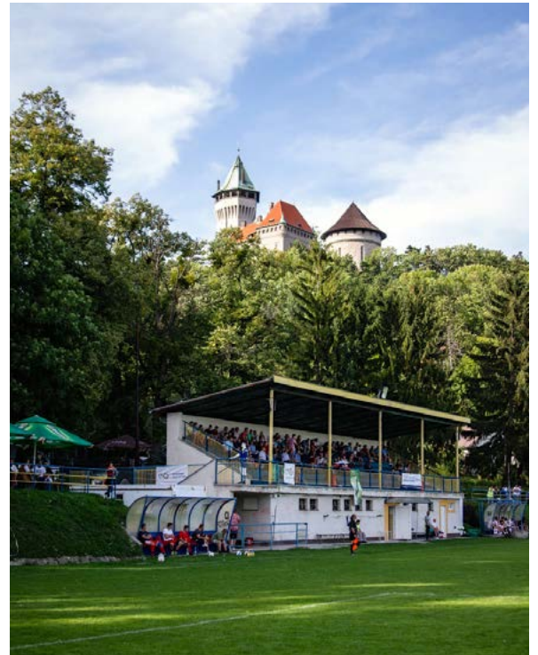
Futbalisti OŠK Smolenice pri zápasoch s TJ Majcichov (vľavo hore), TJ Boleráz (vľavo dolu) a Lokomotívou Trnava (vpravo).