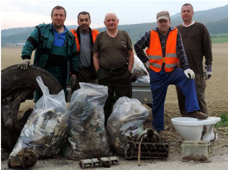
Medzi odpadkami v okolí železničnej stanice sa našli aj kuriozity ako pneumatika či toaleta.

veľkoobjemový kontajner, ktorý zabezpečila obec Smolenice a bude nutné pristaviť ešte jeden. Aby ste si vedeli lepšie predstaviť, aké množstvo odpadu sa podarilo nazbierať za tieto dve popoludnia, jednalo sa približne o dvanásť kubických metrov.